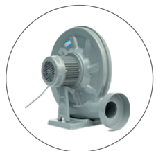
Extracteur de Fumée