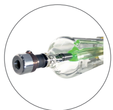
Tube laser RECI