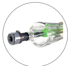
Tube laser RECI