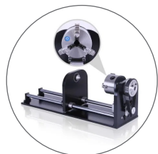
Tourne-cylindre pour les objets cylindriques.