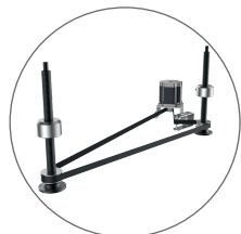
Table réglable en hauteur