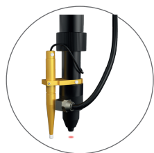
Mise au point automatique Autofocus