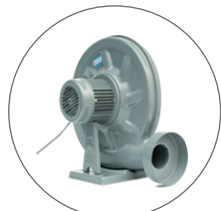
Extracteur de Fumée